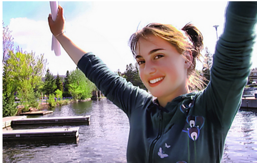
"מרגישות יותר פמיניסטיות מחברותיהן שאינן מנהלות אורך חיים יהודי-דתי". מתוך הסרט

בראיון ל-ynet מספר ניידיק כי הכל החל בשיחת טלפון משותפה-לשעבר לעסקי הדוקו, שחזרה בתשובה. "היא התקשרה אלי, ואמרה: הבת שלי הולכת לסמינר שנמצא בסנט אגאט. אם תצלם את זה, אני אוכל לראות אותה, ועוד כהוצאה מוכרת כשותפה בהפקה".